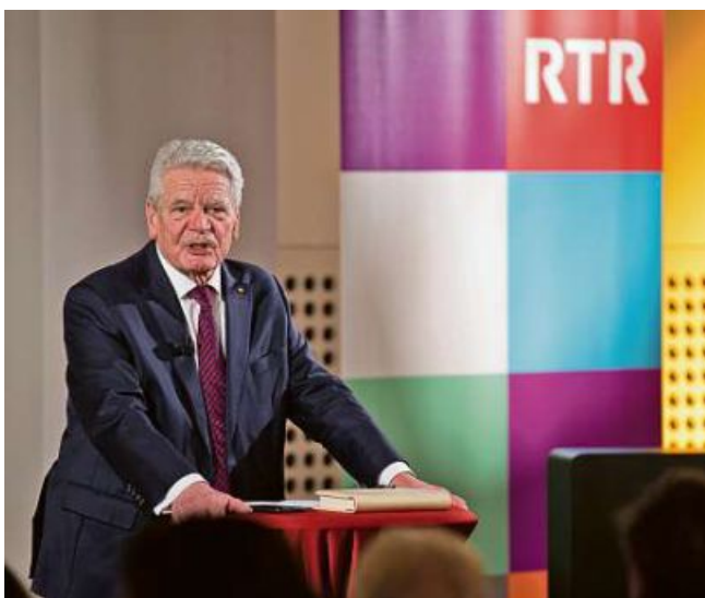
Dal 2012 enfin ils 2017 è Joachim Gauck stà il president da la Germania.