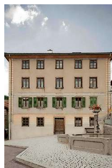
Drei Zimmer – null Sterne: Origens neues Hotel «Frisch»

Leer gestanden ist seit einigen Jahren auch das Schulhaus der Gemeinde. Hier sind nun die textilen Werkstätten eingezogen. Damit wird der Versuch gestartet, hochqualitatives Handwerk im Umfeld des Festivals anzusiedeln und neue Arbeitsplätze zu schaffen.